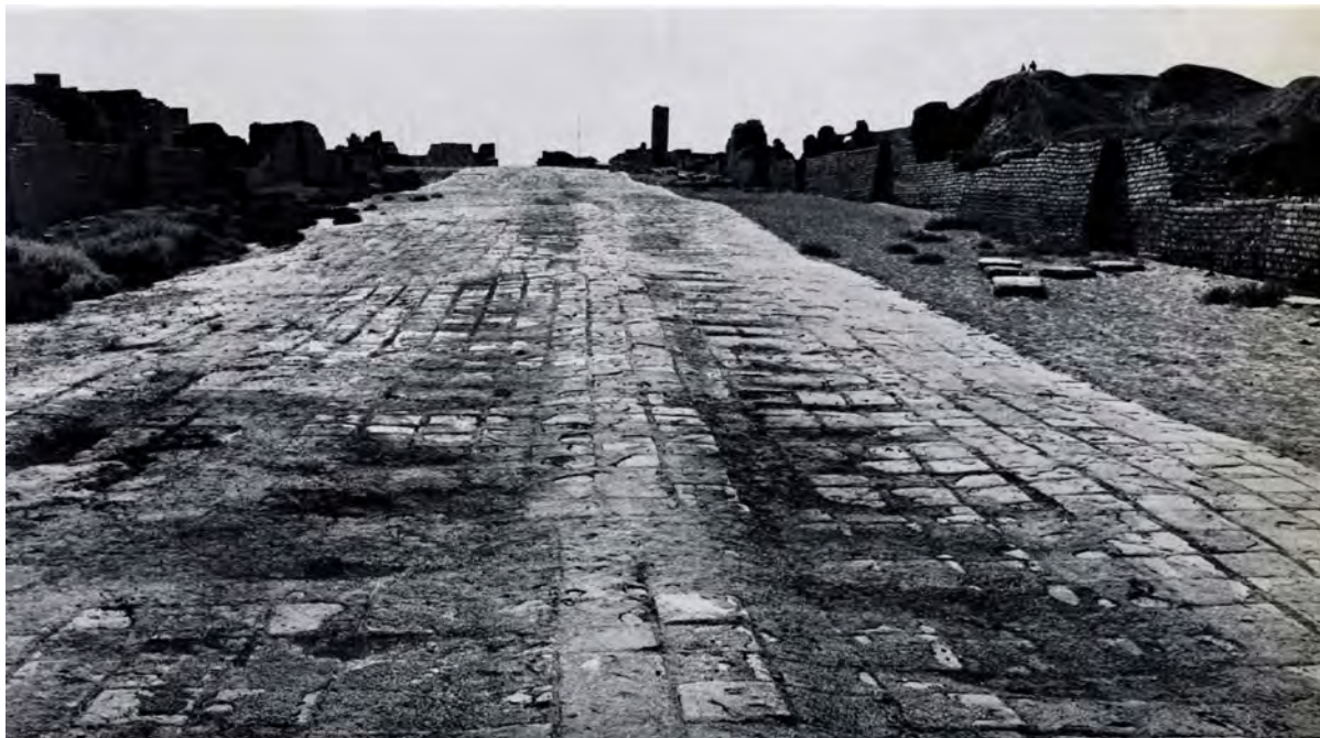
Abb. 5 Die Ischtartorstraße in Babylon. In einem Tempel aus dem Jahr 590 v. Chr. hat sich Nebukadnezar II. als ihr Erbauer gerühmt.

Die zwei Teile wurden durch mehrere große, geradlinige Straßen in Bezirke unterteilt.