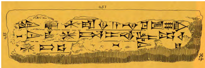
Abb. 2 „Nebukadnezar, König von Babylon, Sohn Nabopolassars, König von Babylon, bin ich. Die Babelstraße habe ich für die Prozession des großen Marduk mit Schadi- (=Gebirgs-) Steinplatten gepflastert. Marduk, Herr, schenke ewiges Leben!“

Unter Nebukadnezar II. (605-662 v. Chr.) erlebte Neubabylon seine Glanzzeit. Die Prozessionsstraße, 16 Meter breit wurde angelegt. Sie führte durch das Ischtartor, vorbei an den Hängenden Gärten der Semiramis zum Tempelbezirk. 2