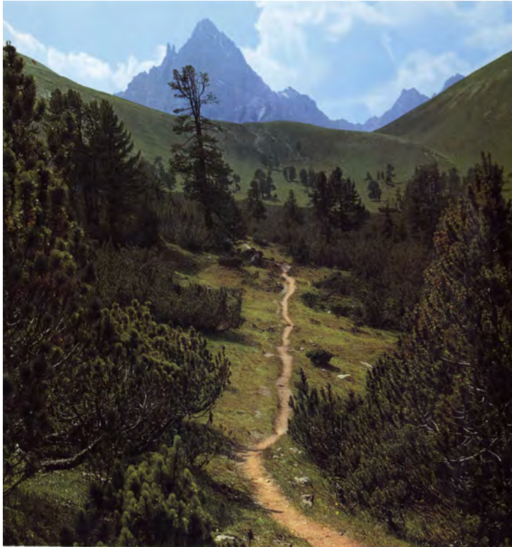
Abb.1 Der ausgetretene Pfad umgeht Hindernisse und ist selten die kürzeste Verbindung zweier Punkte. Wird er nicht regelmäßig begangen, nimmt ihn sich die Natur zurück.

Viele Lebewesen sind auf die Fortbewegung am Boden angewiesen. Die Natur macht es ihnen aber nicht leicht. Unwegiges Gelände, undurchdringliches Dickicht, reißende Flüsse und steile Schluchten stellen sich ihnen entgegen. Zwei Möglichkeiten gab es um zu überleben: Anpassung oder Veränderung. 1