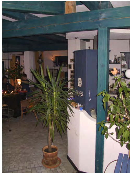
Abb. 1 Das Carrara Kleinsteinspflaster als Bodenbelag im Innenraum. Der Heizestrich wurde zweilagig eingebracht. Die obere Schicht ist zugleich Mörtelbett für die Steine.

Mittlerweile erfreut sich der versetzte Stein allgemeiner Beliebtheit. Das Angebot an Literatur erweiterte sich rasch. Heidi Howcroft hat an die zwanzig Bücher zu dem Thema geschrieben und andere Autoren tun es ihr gleich. Baumärkte bieten Material für jedermann, Kurse werden abgehalten, spezielle Natursteinmärkte werden eröffnet, Stein wird aus den entlegensten Winkeln der Erde importiert