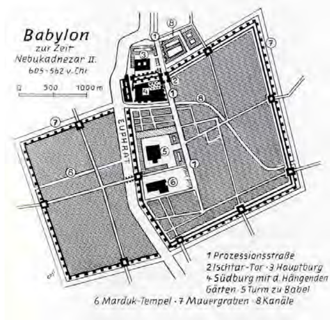
Abb. 4 Grundriss Babylons. Die Stadt setzte sich aus zwei ungleichen Hälften zusammen, die durch eine, laut Herodot, 123 Meter lange Brücke aus libanesischem Zedernholz verbunden waren.

Die zwei Teile wurden durch mehrere große, geradlinige Straßen in Bezirke unterteilt.