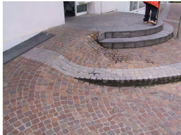
Abb. 2 Schwemmt das „Fließen“ auch Kundschaft in das Geschäft?

Meine ursprüngliche Idee war es zu erforschen, ob sich Menschen durch die Gestaltung des „Untergrundes“ lenken, leiten, beeinflussen und manipulieren lassen. Ich wollte herausfinden, ob ich ein gewisses Klientel - zahlungskräftige Kunden zum Beispiel -, durch die Gestaltung des Bodens in ein Geschäft „locken“ kann. Auch inwieweit sich der Innenraum nach außen erweitern lässt, oder der öffentliche Bereich sich in der Lokalität fortsetzen kann ist von Interesse.