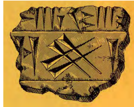
Abb. 1 Sumerisches Keilschriftzeichen für „Straße“. Vielleicht sogar die symbolische Darstellung einer Kreuzung.

Die altbabylonische, assyrische und sumerische Zeit sind in geheimnisvollem Dunkel gehüllt. Nur wenige Ausgrabungsfunde lassen auf eine außergewöhnlich hochstehende Kultur schließen. Gebaute Straßen und Wege gab es sicher schon, zumindest in den Tempelbezirken und die Herrscher hatten bestimmt den Wert von befestigten Nachschub- und Transportwegen erkannt. Wagen und Gespanne gehörten zur Ausstattung der Armee und die sumerische Schrift kannte bereits ein Zeichen für „Straße“. 1 Kultstraßen waren mit Natursteinplatten belegt und wiesen einen ausgeklügelten Unterbau auf.